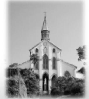
世界遺産登録推進特別委員会委員長として頑張っています。

全国でも知名度が抜群に高い街、それなのに訪問する観光客がじり貧となっています。長崎の美しさを磨き、また訪れたいと思わせる街づくりを皆さんと共に進めます。