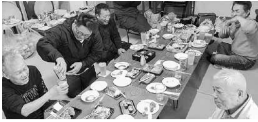
福田天満宮—福田分会—

一方、福田分会では、福田天満宮境内の桜の下で、お酒と料理を囲んでの花見会を予定していましたが、開始直前にわか雨により、隣の社務所に場所を移して花見会をスタート。準備し