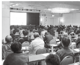
特別講演「働き方改革対策について」

賃金引上げと仕事確保について、十一年連続して公共工事設計労務単価は上昇していますが、実質賃金はほとんど上昇していないのが現状です。一方、四月から建設業でも働き方改革関連法案が全面適用となり現場従事者の処遇改善や、公共工事におけるCCUSを適用した事業所への優遇措置が各自治体単位で進められています。今後も中小建設業協会と連携を図りながら、各自治体や大手建設業者に対して賃金の引き上げや労働条件改善、仕事確保の要望・要請を行ってまいります。衆議院選挙について私たちの諸要求実現のためには推薦議員の皆様のお力は不可欠です。推薦議員全員の当選を勝ち取り、組合の運動を一緒に進めていくためにも、皆様方のご支援をよろしくお願い致します。